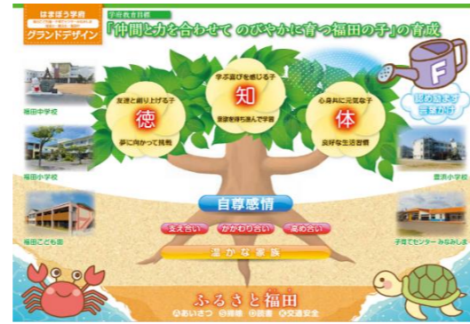
はまぼう学府グランドデザイン

福田地区については地域主体でワークショップや講演会などを開き、新たな学校づくりを検討してきた経緯や、同地区地域づくり協議会連絡会長や各地区長から要望書の提出を受けたことなどを説明されました。