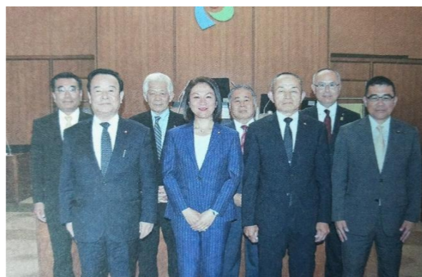
建設産業委員会メンバーです。 委員長として誠実に一生懸命頑張ります！

各委員会の所管事務調査内容や過去の調査報告書等については『磐田市HP → 磐田市議会』で検索できます。