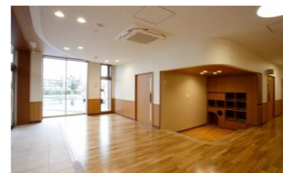
☞「かるみあ」入ってすぐに絵本コーナーがあります

☞ 4月24日、チャレンジ工房磐田内にイートインスペースを併設したベーカリー「CHOUCHOU（シュシュ）」がオープンしました。是非、気軽にお立ち寄りください。