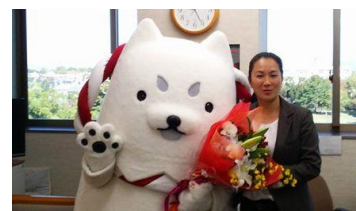
今年も頑張ります!!

結びに、皆様にとりまして、本年が輝かしい一年となりますことを心よりご祈念申し上げ、新年のごあいさつとさせていただきます。